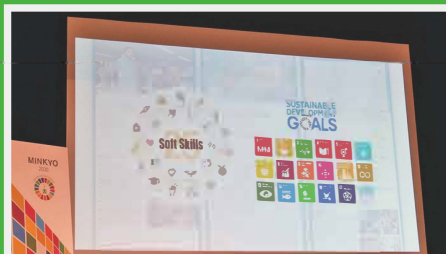
ETでは、さまざまな学校や教育関係企業と連携しながら、オンライン・オフラインのイベントを多数開催。Web+αでの教育改革をサポートします。