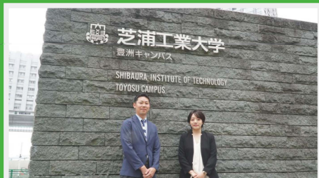
日本を牽引する学校関係者に直接インタビューを実施。企画から取材まで丁寧に行い、ETでしか読めない最新情報を引き出します。

京都大学、早稲田大学、慶應義塾大学、芝浦工業大学、山脇学園中学校・高等学校、京都産業大学附属高等学校、東洋英和女学院中部・高等部、奈良県教育委員会、デジタルハリウッド大学、サイバーエージェント、ミクシィ、DeNA、サイバーエージェント、アドビ、日本マイクロソフト、ベネッセ、早稲田塾